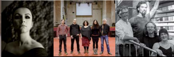
Sky Blue Skin